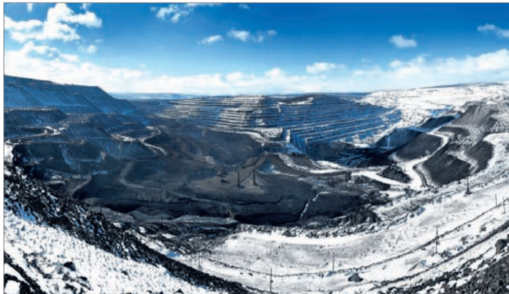
Разрез Нерюнгринский. Наши дни.

Сегодня горняки этих разрезов выполняют государственную программу Северного завоза — поставляют уголь на предприятия ЖКХ, чтобы обеспечить жителям республики комфортное прохождение суровой якутской зимы.