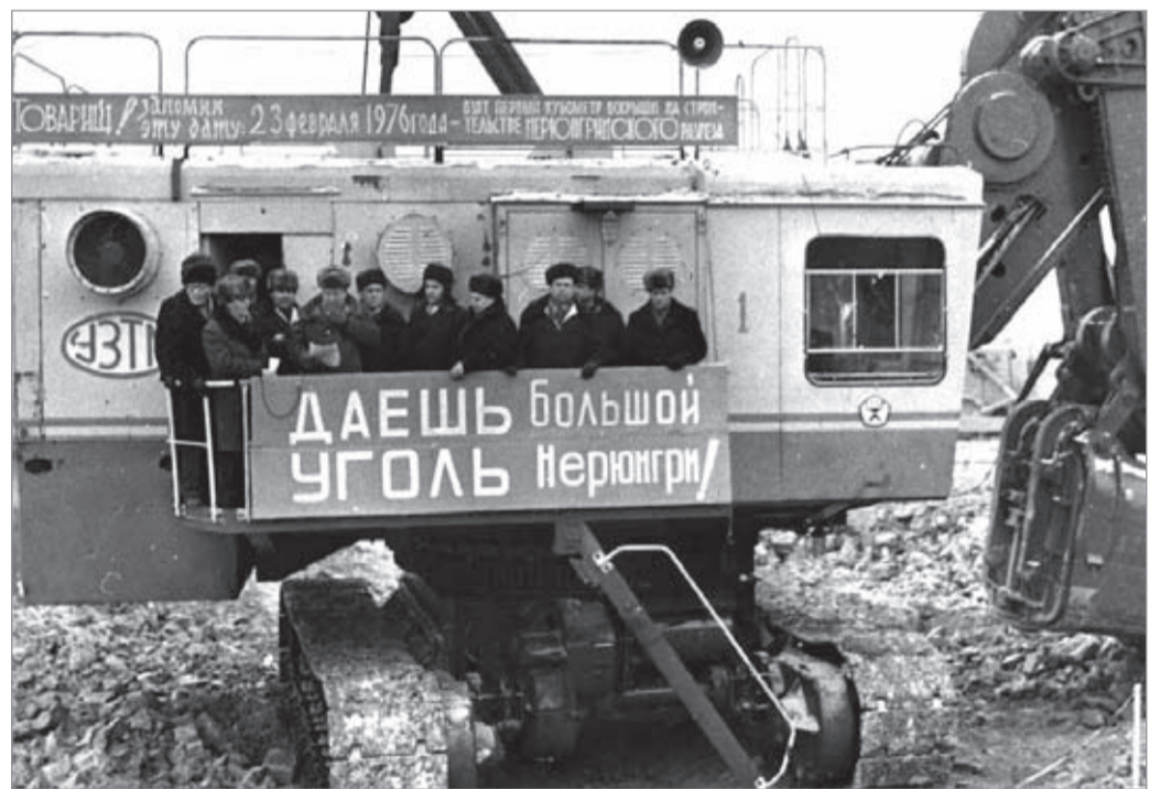
Первый кубометр вскрышки