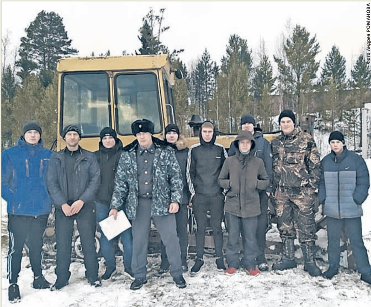
Студенты Профессионального колледжа сдали экзамен в Гостехнадзоре

Для того чтобы получить специальность машиниста бульдозера, студенты ПКЖИ прошли медкомиссию. Это обязательное условие, так как в этой профессии требуются хорошее здоровье, выносливость и физическая сила. Также человек должен обладать хорошим зрением и слухом, скоростью реакций, а кроме того, развитым глазомером. Машинист бульдозера должен уметь перерабатывать своё внимание, иметь хорошую зрительную память и предрасположенность к выполнению технических работ.