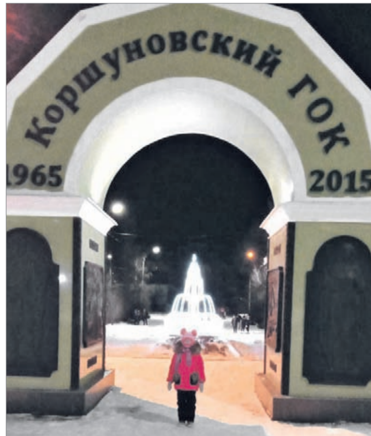
Сегодня площадь М.К. Янгеля украшают символизирующая Коршуновский ГОК стела и новый светодиодный фонтан. Но скоро преобразится и окружающая площадь лесная парковая зона

Администрация города Железногорска-Илимского